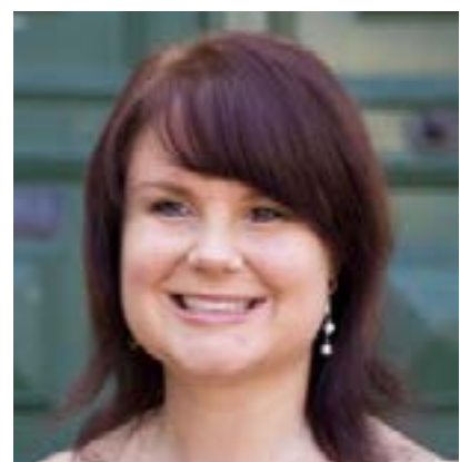
Frau Seehaus in Darmstadt