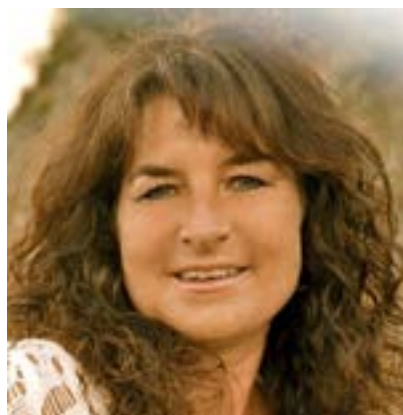
Frau Luh in Frankfurt