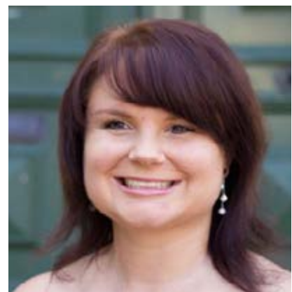
Frau Seehaus in Darmstadt